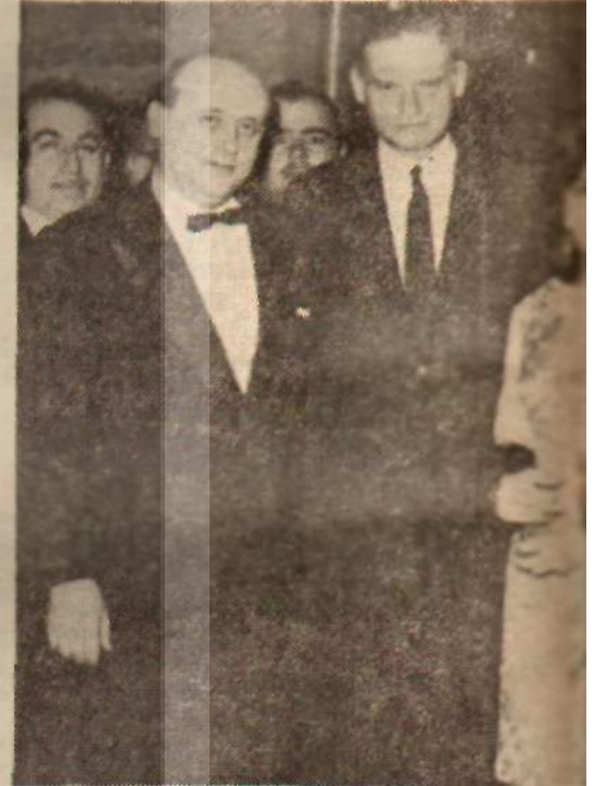
Süleyman Demirel ile İzzettin Turanlı ve eşi

sonra, bir gün Turanlı'nın iş ortaklarından eski DP. milletvekili Serefyan (İstanbul tanınmış tüccarlarından) Ankara'ya geldi. O, önemli bir iş vardı. Bunu mutlaka kendilerinin almaları gerekiyordu. Turanlı Demirel ile Serefyan'ı buluşturdu, birlikte konuştular. İlgili Bakanla da görüştikten sonra Serefyan doğrudan uçağa atıldı ve New York'a gitti. Serefyan birkaç gün sonra gayet neseli olarak New York'tan dönüyordu. Ve iş, tatlı bir sona bağlanıyordu.