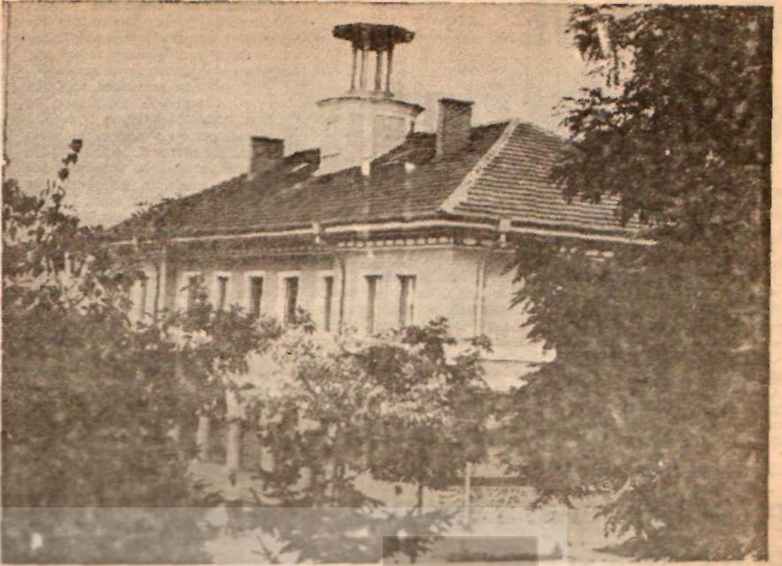
Kuklen köyünün «Kültür Evi»